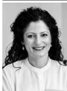
Cansel Kiziltepe Mitglied des Deutschen Bundestages

Ein sehr wichtiges Instrument ist hier auch das kommunale Flächenmonitoring, um Potenziale für Nachverdichtung sichtbar zu machen. Die Umnutzung von Gebäuden bietet ebenfalls Möglichkeiten mehr Wohnraum zu schaffen.